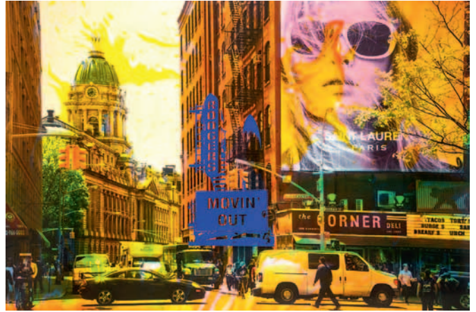
Helle Jetzig, NY Reloaded B 5 , Malerei und Siebdruck auf S/W Fotografie, 100 × 150 × 6 cm, Courtesy Galerie von Braunbehrens, Stuttgart